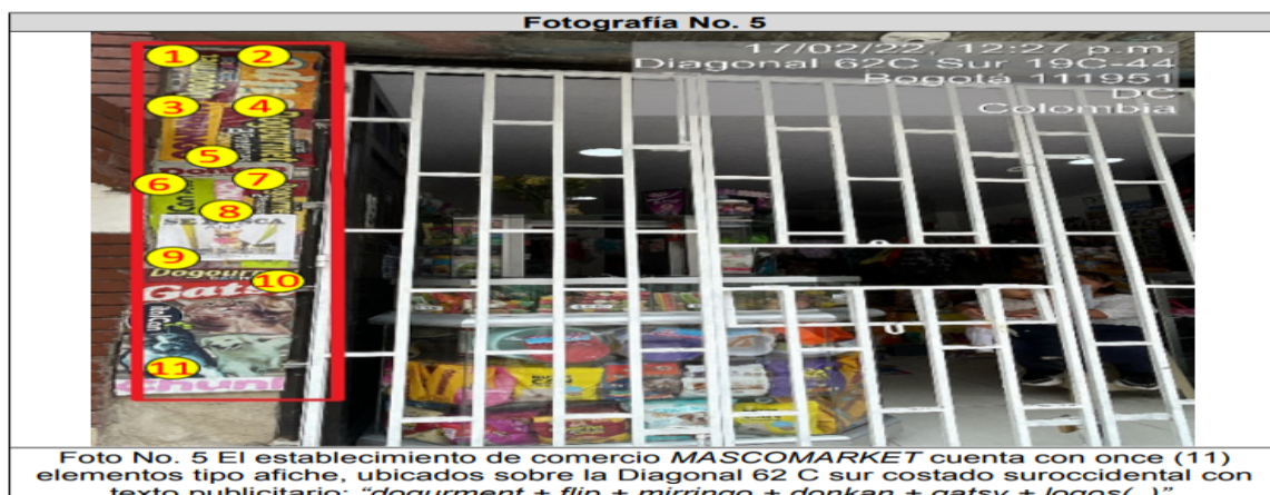
Foto No. 5 El establecimiento de comercio MASCOMARKET cuenta con once (11) elementos tipo afiche, ubicados sobre la Diagonal 62 C sur costado suroccidental con texto publicitario: "dogurment + flip + mirringo + donkan + gatsy + logos(.)".