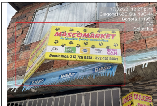
Foto No. 3 El establecimiento de comercio MASCOMARKET cuenta con un (1) elemento tipo aviso en fachada ubicado sobre la Diagonal 62 C sur, el cual se encuentra volado de la fachada, con texto publicitario: "Macomarket + artículos para mascotas + logos + domicilios + números"