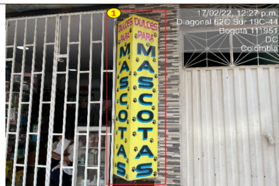
Foto No. 4 El establecimiento de comercio MASCOMARKET cuenta con un (1) elemento publicitario el cual está ubicado de manera vertical, sobre la Diagonal 62 C sur costado suroccidental, con texto publicitario: "dulces + para + mascotas".